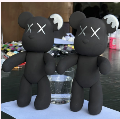
Фото качественных работ · Bear Bricks