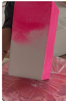
Оптимальный слой тонкий, ровный, наносится спонжем/губкой