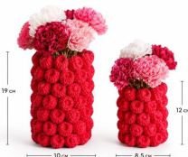
Ваза «Малинка» S

Высота: 12 см Внутренний диаметр: 8,5 см Доступный цвет: малиновый