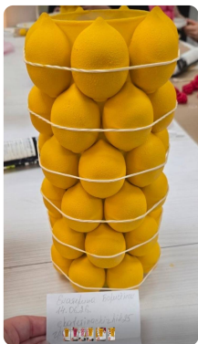
Текстура на лимончиках — губка + 2 слоя

Это самый долгий этап. Если клиент сильно отстаёт — можно помочь ему покрасить пару фигурок , если он не против.