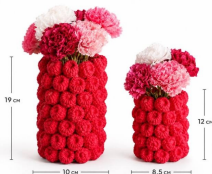
Ваза «Малинка» M

Высота: 19 см Внутренний диаметр: 10 см Доступный цвет: малиновый