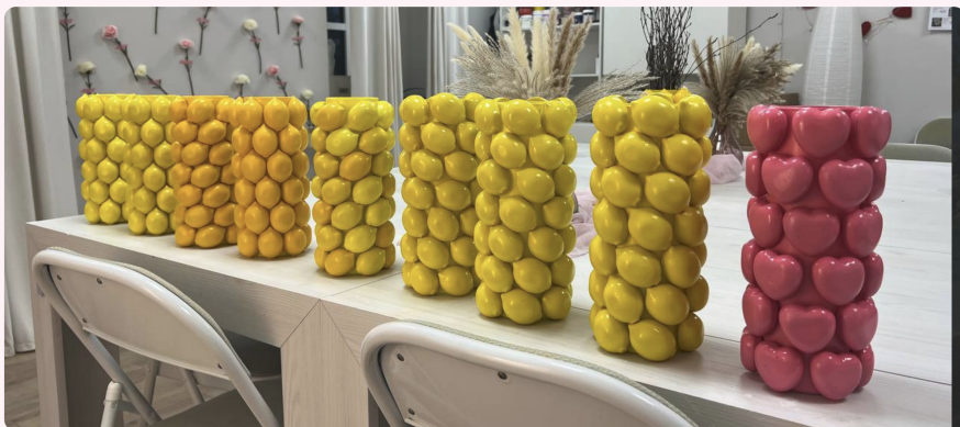
Примеры готовых работ — референсы расположения фигурок

Важно понимать диаметр вазы — располагать фигурки так, чтобы они помещались в ряд, но не было сильных дыр .